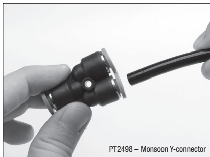
PT2498 – Monsoon Y-connector

ADDITIONAL ACCESSORIES AVAILABLE ACCESSOIRES SUPPLÉMENTAIRES DISPONIBLES ZUSÄTZLICHES ZUBEHÖR ERHÄLTICH ACCESORIOS ADICIONALES DISPONIBLES ACCESSORI AGGIUNTIVI DISPONIBILI EXTRA ACCESSOIRES VERKRIJGBAAR