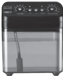
MONSOON SOLO II Programmable Misting System