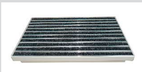
Ripsmatte für den Innenbereich oder überdachten Außenbereich