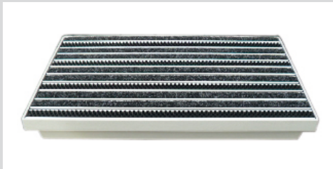
Ripsmatte mit Bürsteneinlage für Innen- und Außenbereich

Lieferbare Größen: 60 x 40 x 7 cm 75 x 50 x 7 cm 100 x 50 x 7 cm