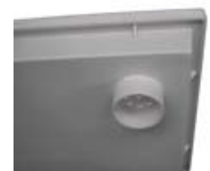
Serienmäßiger Ablaufanschluss NW70 mit Schmutzsieb